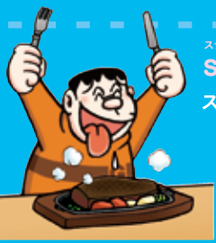
ステーキ steak ステーキ