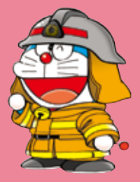
ファイアファイター firefighter 消防士