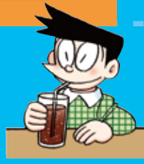
コーラ cola コーラ