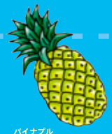
パイナップル pineapple パイナップル