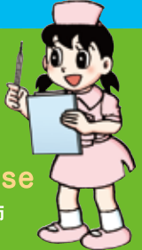
ナース nurse 看護師