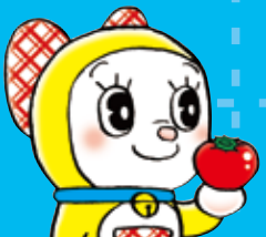
トマト tomato トマト